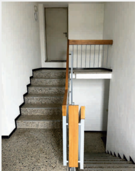
Die Ansicht des Gebäudes, der Eingangsbereich und das Treppenhaus