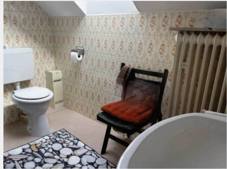
Das zusätzlich ausgebaute Zimmer mit Bad

E in Haus mit solider Substanz, viel Platz und einem Garten, der in dieser Form selten zu finden ist – ideal für Familien, die sich ihren Wohntraum nach eigenen Vorstellungen verwirklichen möchten.