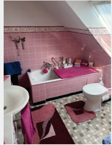
Das Bad und einer der Räume mit Balkonim Obergeschoss