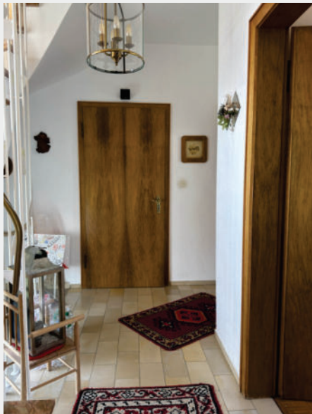
Die Hausansicht, die Diele und das Gäste-WC